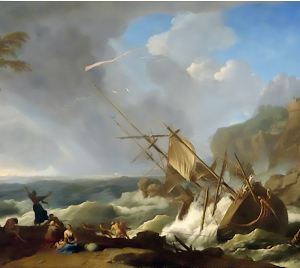
Adrien Manglard, Naufraziul , 1715

Grigore Alexandrescu (1810/1812?–1885), poet, prozator. S-a format întâi la Târgoviște, în orașul natal, apoi, după moartea timpurie a părinților, la București, la școala lui Vaillant și la Liceul „Sfântul Sava”, unde se remarcă printr-o memorie ieșită din comun. Colegii de clasă aproape că îl invidiau: tânărul era capabil să recite versuri întregi în limbile greacă și franceză: „De copil, Alexandrescu cunoștea poezii grece vechi și moderni; la vârsta de șaptesprezece ani citea pe toți clasicii francezi și știa pe dinafară tot ce era măreț și frumos în literatură”, notează Ion Ghica. Dintre poezii români, îl admira pe lancu Văcărescu, acela care i-ar fi spus: „Băiete, tu o să fii un poet mare”. Îndeplinește apoi, în anii următori, câteva roluri trecătoare: în armată (ca ofițer), la Secretariatul Statului (ca funcționar), la Poporul suveran , un organ al Revoluției de la 1848 (ca redactor). Activează o