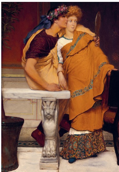
Lawrence Alma-Tadema, Oglinda , ulei pe pânză, 1868